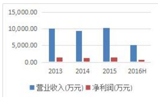
图一 营业收入及净利润(万元)